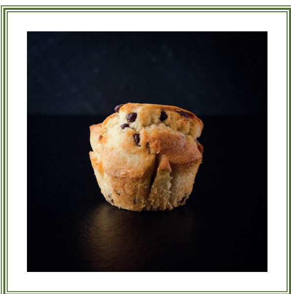
Muffin mit Schokoladenstückchen